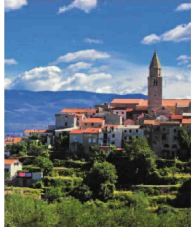
KRK. Die Insel ist für kulturelle Schätze und das klarste Wasser des Mittelmeers bekannt.